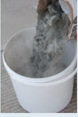
Harç suya eklenmesi