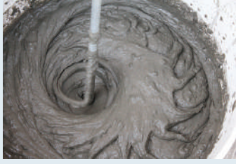
Karıştırıcı ile karıştırma