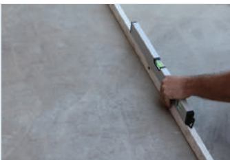
Yüzeyin düzgünlüğünün kontrol edilmesi