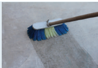
Yüzeyin temizlenip nemlendirilmesi