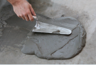
Harç mala yardımı ile yüzeye aktarılması