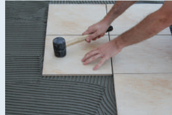
Çekiçle vurulup seviyelendirilmesi